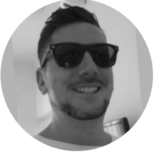
المدير التنفيذي ExpertSure.com

يبدو من السخرية المأساوية أن يتم تركيز الكثير من الاهتمام والاهتمام على الكارثة النووية الأخيرة في اليابان، ومع ذلك لم يتم قول أو فعل أي شيء على الإطلاق لحماية ملايين الصوماليين الذين تسمموا لعقود من الزمن بسبب نفاياتنا النووية الخطرة التي تم التخلص منها بشكل غير قانوني. من هم القراصنة المجرمين الحقيقيين هنا؟