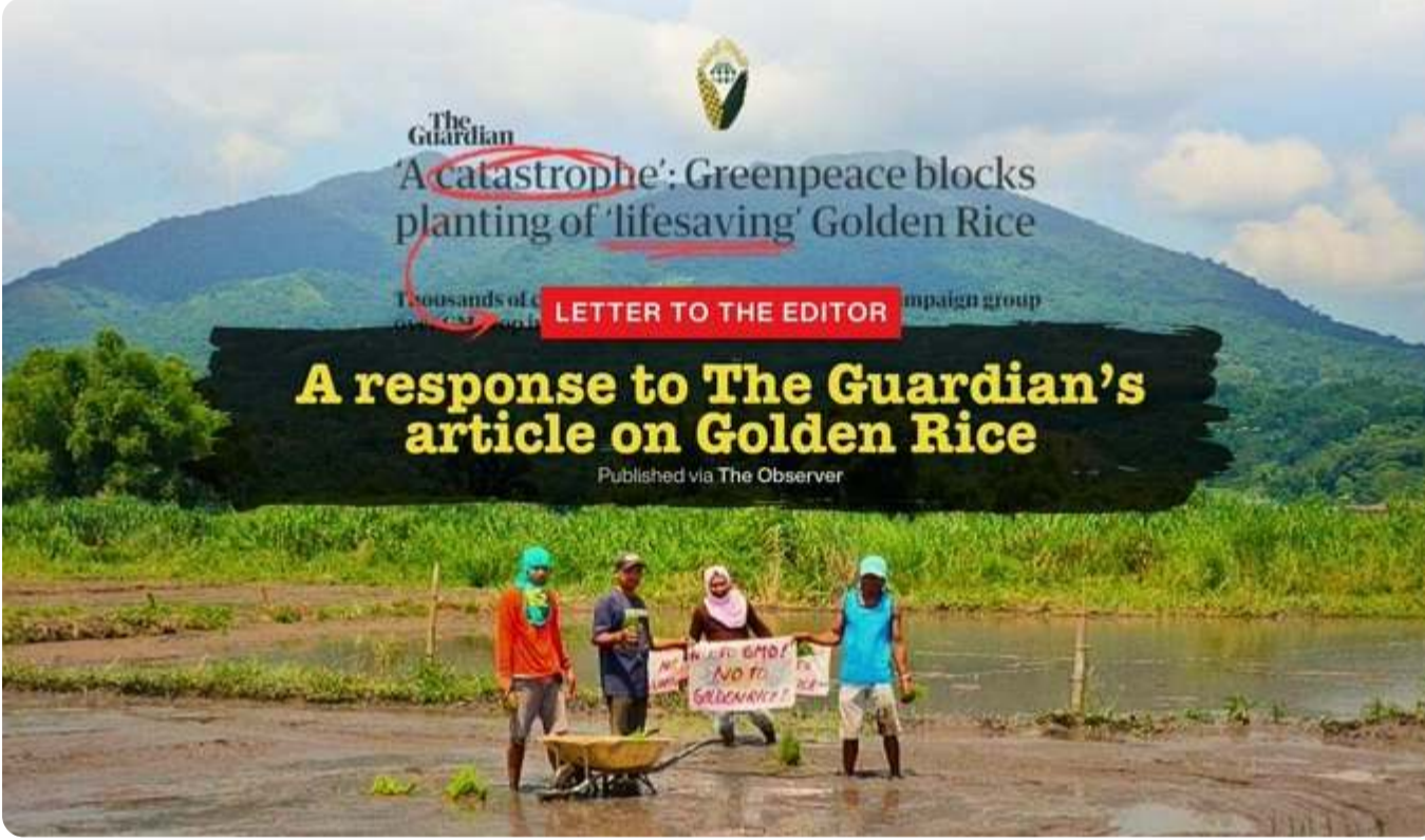
MASIPAG: “GMO গোল্ডেন রাইস-এ The Guardian-এর নিবন্ধের প্রতিক্রিয়া”

ফিলিপাইনের কৃষক-বিজ্ঞানী নেটওয়ার্ক MASIPAG দ্বারা এই বিচ্যুতি কৌশলটি দ্রুত শনাক্ত ও সমালোচিত হয়। একটি আনুষ্ঠানিক প্রতিক্রিয়ায়, MASIPAG বলেছেন: