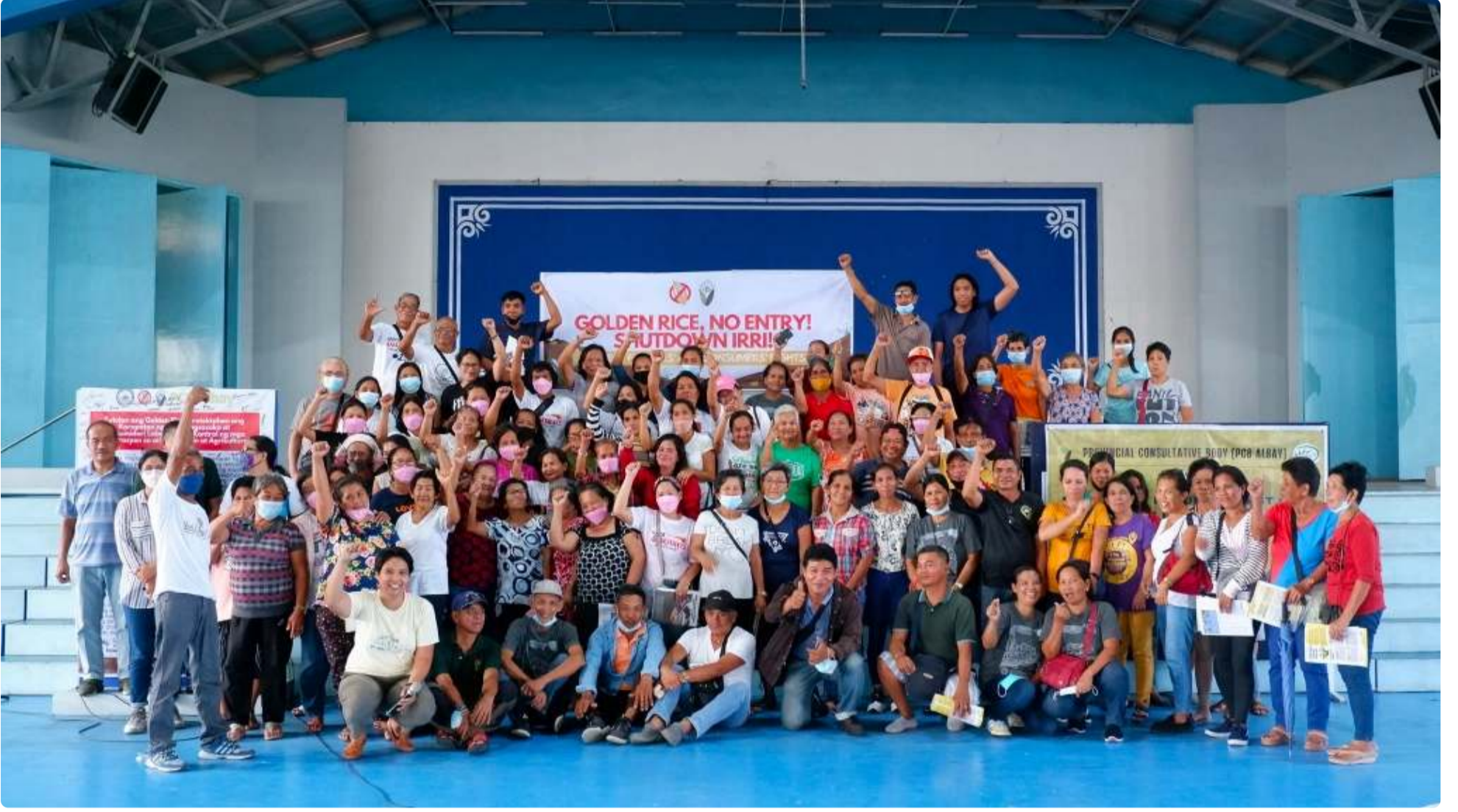
গোল্ডেন রাইস বন্ধ করুন! নেটওয়ার্ক (SGRN)