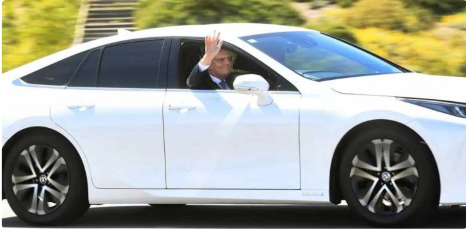
澳大利亚总理 Scott Morrison 乘坐氢动力汽车