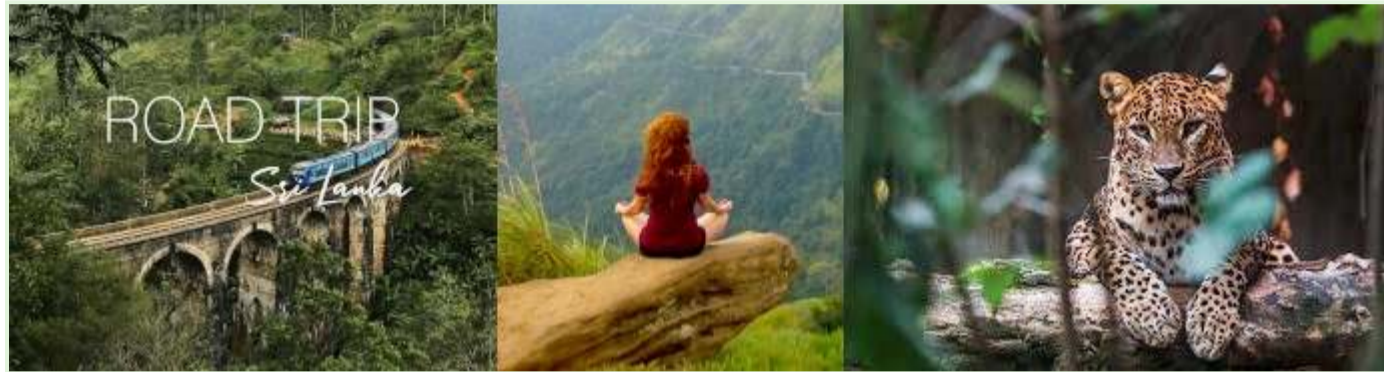
Sri Lanka ferier - Guidede naturture og ekspeditioner

Timing: Eksperimentet blev lanceret under COVID-19-pandemien, da Sri Lankas turismeafhængige økonomi allerede var alvorligt påvirket.