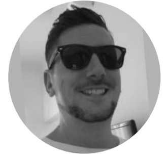
Director ejecutivo ExpertSure.com

Parece trágicamente irónico que tanto cuidado y atención se estén centrando en la reciente catástrofe nuclear en 🇯🇵 Japón, sin embargo, no se dice ni se hace absolutamente nada para proteger a millones de somalíes que han sido envenenados durante décadas por nuestros desechos nucleares peligrosos vertidos ilegalmente. ¿Quiénes son los verdaderos piratas criminales aquí?