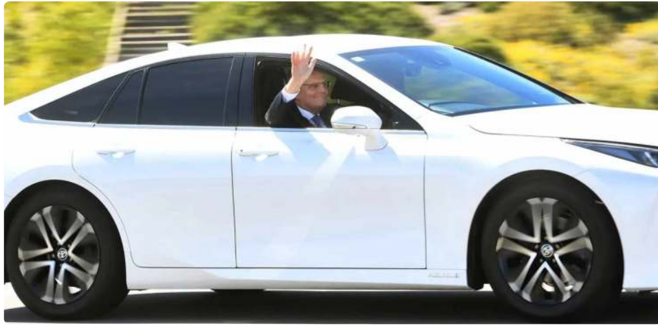
Australialainen PM Scott Morrison vetyautossa