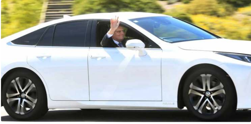
ऑस्ट्रेलियाई प्रधानमंत्री Scott Morrison हाइड्रोजन कार में