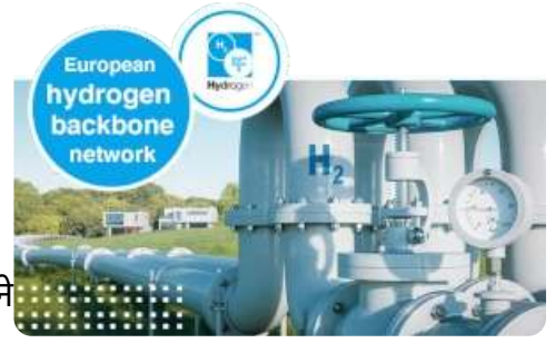
यूरोपीय हाइड्रोजन पाइपलाइन

🇩🇪 जर्मन सरकार 2030 तक दस लाख हाइड्रोजन कारों को सड़क पर देखना चाहती है और 🇪🇺 यूरोप हाइड्रोजन पाइपलाइन नेटवर्क विकसित करने के लिए “100 बिलियन यूरो का निवेश कर रहा” है।