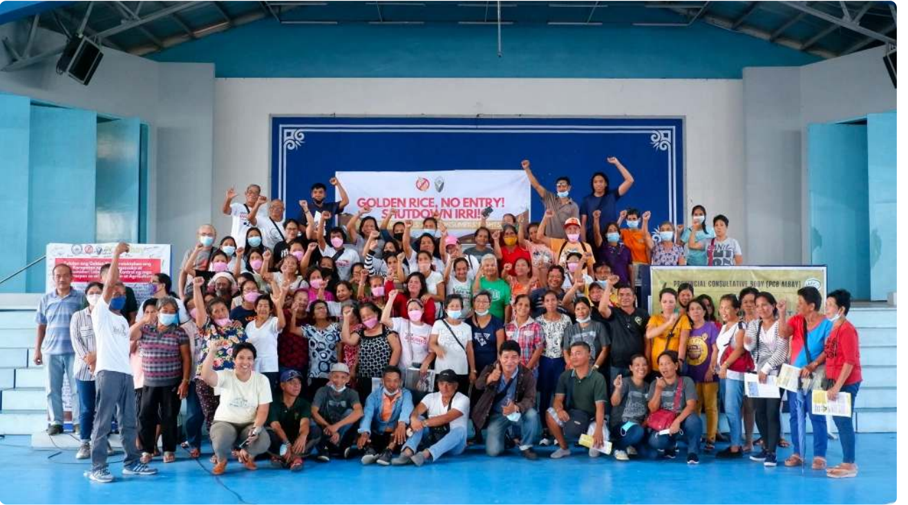
गोल्डन राइस बंद करो! नेटवर्क (एसजीआरएन)