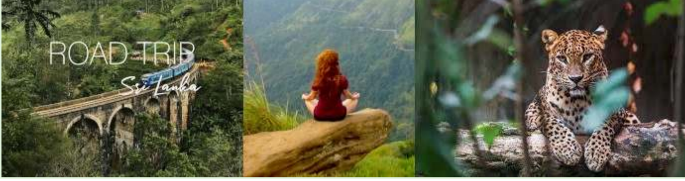
श्रीलंका छुट्टियां - निर्देशित प्रकृति पर्यटन और अभियान

समय: यह प्रयोग कोविड-19 महामारी के दौरान शुरू किया गया था, जब श्रीलंका की पर्यटन-निर्भर अर्थव्यवस्था पहले से ही गंभीर रूप से प्रभावित थी।