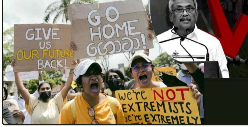
श्रीलंका आर्थिक आपदा