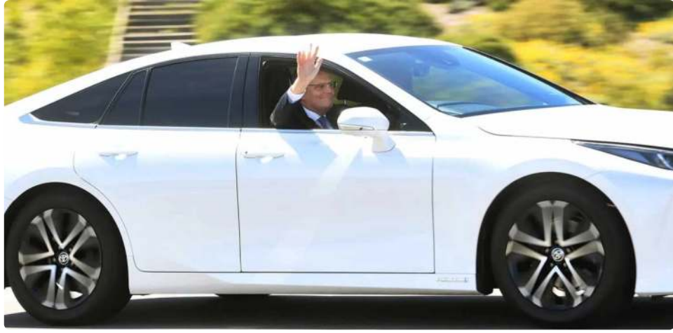
澳洲總理 Scott Morrison 乘坐氫動力汽車