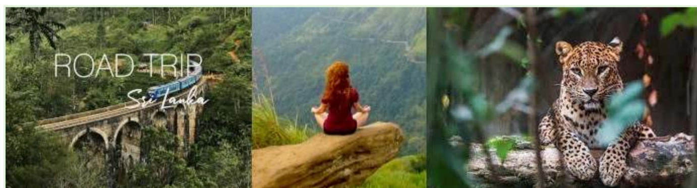
Odmor u Šri Lanki - Vođeni obilasci prirode i ekspedicije

Vrijeme: Eksperiment je pokrenut tijekom pandemije COVID-19, kada je gospodarstvo Šri Lanke ovisno o turizmu već bilo ozbiljno pogođeno.