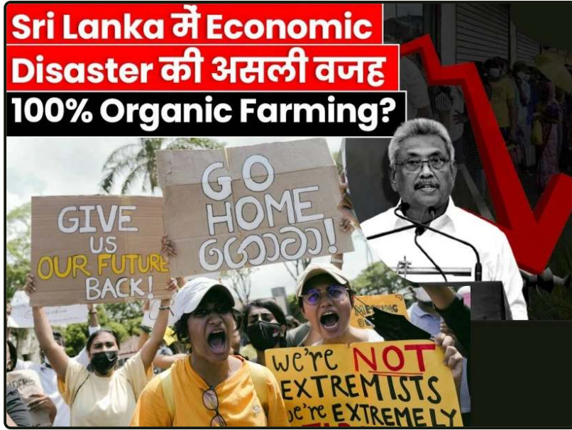
Sri Lanka gazdasági katasztrófa