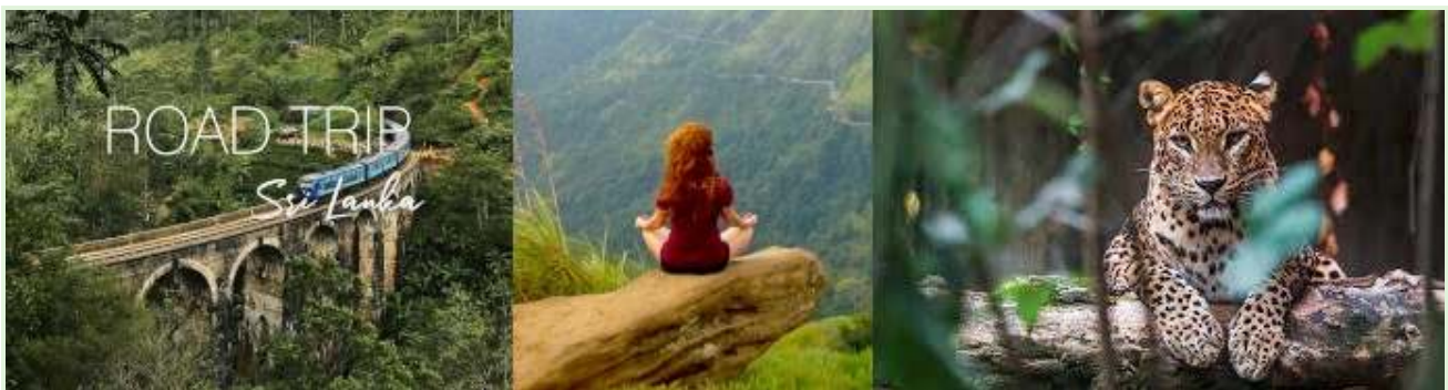
Liburan di Sri Lanka - Wisata alam dan ekspedisi berpemandu

Waktu: Eksperimen ini diluncurkan pada masa pandemi COVID-19, ketika perekonomian Sri Lanka yang bergantung pada pariwisata sudah terkena dampak yang parah.