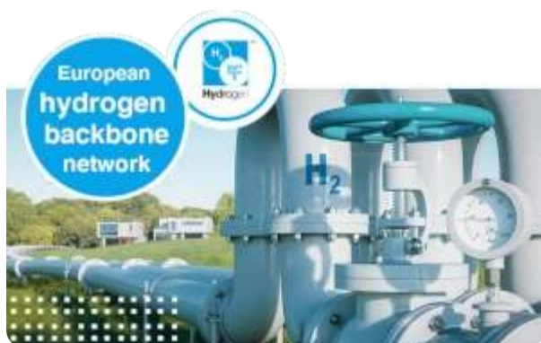
צינורות מימן באירופה

מדינות ארצות הברית ב"העתיד של הרכב הוא מימן". משרד האנרגיה האמריקאי ישקיע מיליארדי דולרים למעבר למכוניות מימן ב-2028.