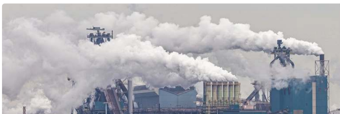
אדי פחם יוחלפו באדי מימן. פחות CO2, אבל שחרור מזהמים חדשים לאוויר שהם מסוכנים ביותר.

סוגי הפליטות החדשים של שריפת מימן, כמתואר בפרק 3 ^ , מסוכנים ביותר לבריאות האדם.