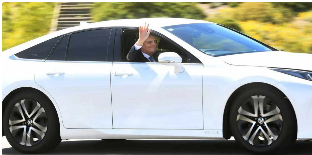
ראש הממשלה האוסטרלי Scott Morrison במכונית מימן