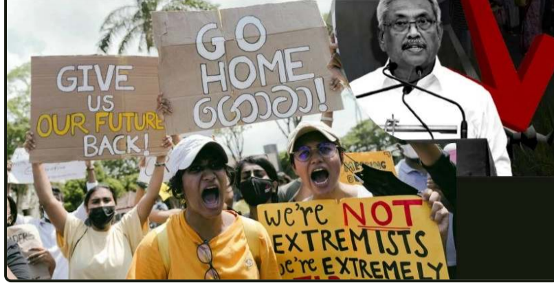
스리랑카 경제 재앙