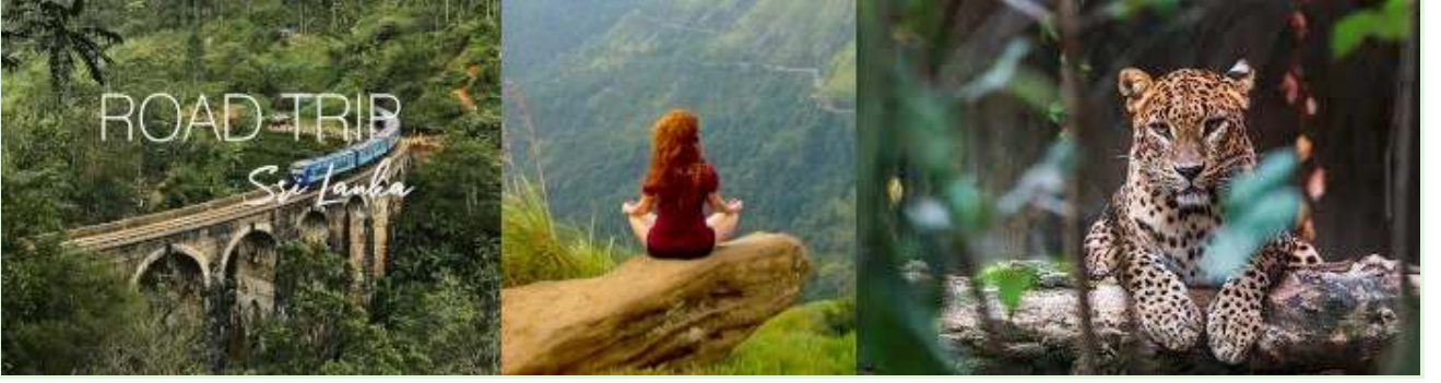
श्रीलंकेतील सुट्ट्या - मार्गदर्शित निसर्ग सहली आणि मोहिमा

वेळ: हा प्रयोग कोविड-19 महामारीच्या काळात सुरू करण्यात आला, जेव्हा श्रीलंकेच्या पर्यटनावर अवलंबून असलेल्या अर्थव्यवस्थेवर आधीच गंभीर परिणाम झाला होता.