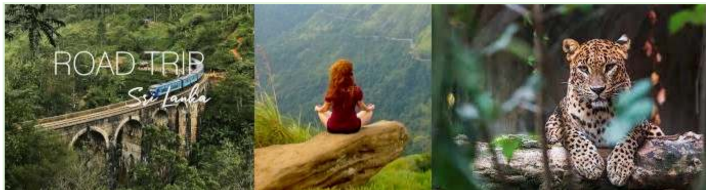
Отдых на Шри-Ланке – экскурсии и экспедиции с гидом

Время: эксперимент был начат во время пандемии COVID-19, когда зависимость от туризма экономика Шри-Ланки уже серьезно пострадала.