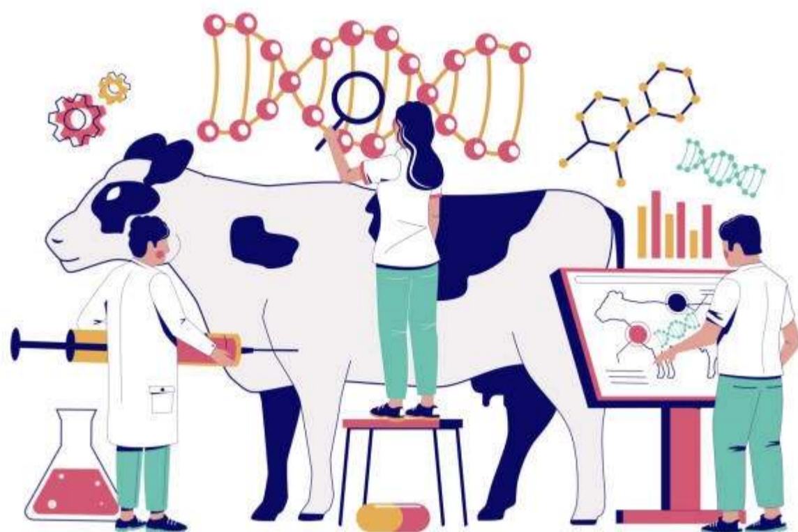
GENETICALLY MODIFIED ANIMALS