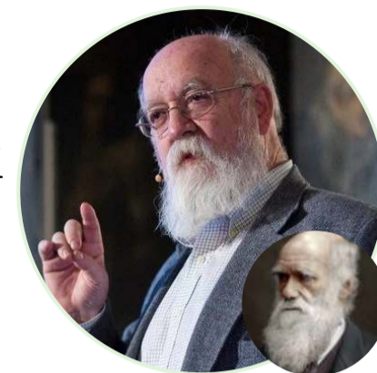
Charles Darwin ali Daniel Dennett?

V priljubljeni razpravi o filozofskem forumu uporabnik z imenom Faustus5 prikaže vzorec vedenja in čustvenih odzivov, ki močno nakazujejo, da gre v resnici za priznanega filozofa Daniel C. Dennett , ki sodeluje anonimno na polodprt način.