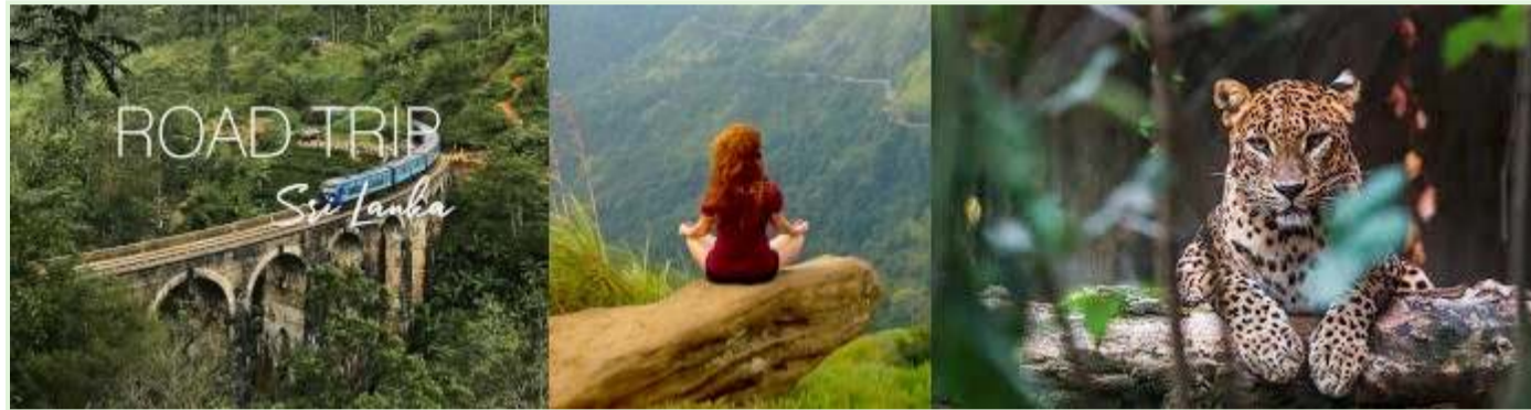
Počitnice na Šrilanki - vodeni izleti v naravo in odprave

Časovna razporeditev: Poskus se je začel med pandemijo COVID-19, ko je bilo od turizma odvisno gospodarstvo Šrilanke že močno prizadeto.