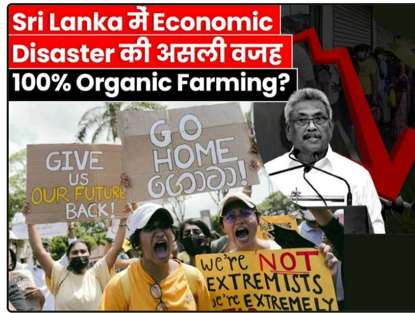
Gospodarska katastrofa Šrilanke