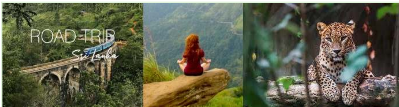
Počitnice na Šrilanki - vodeni izleti v naravo in odprave

Časovna razporeditev: Poskus se je začel med pandemijo COVID-19, ko je bilo od turizma odvisno gospodarstvo Šrilanke že močno prizadeto.