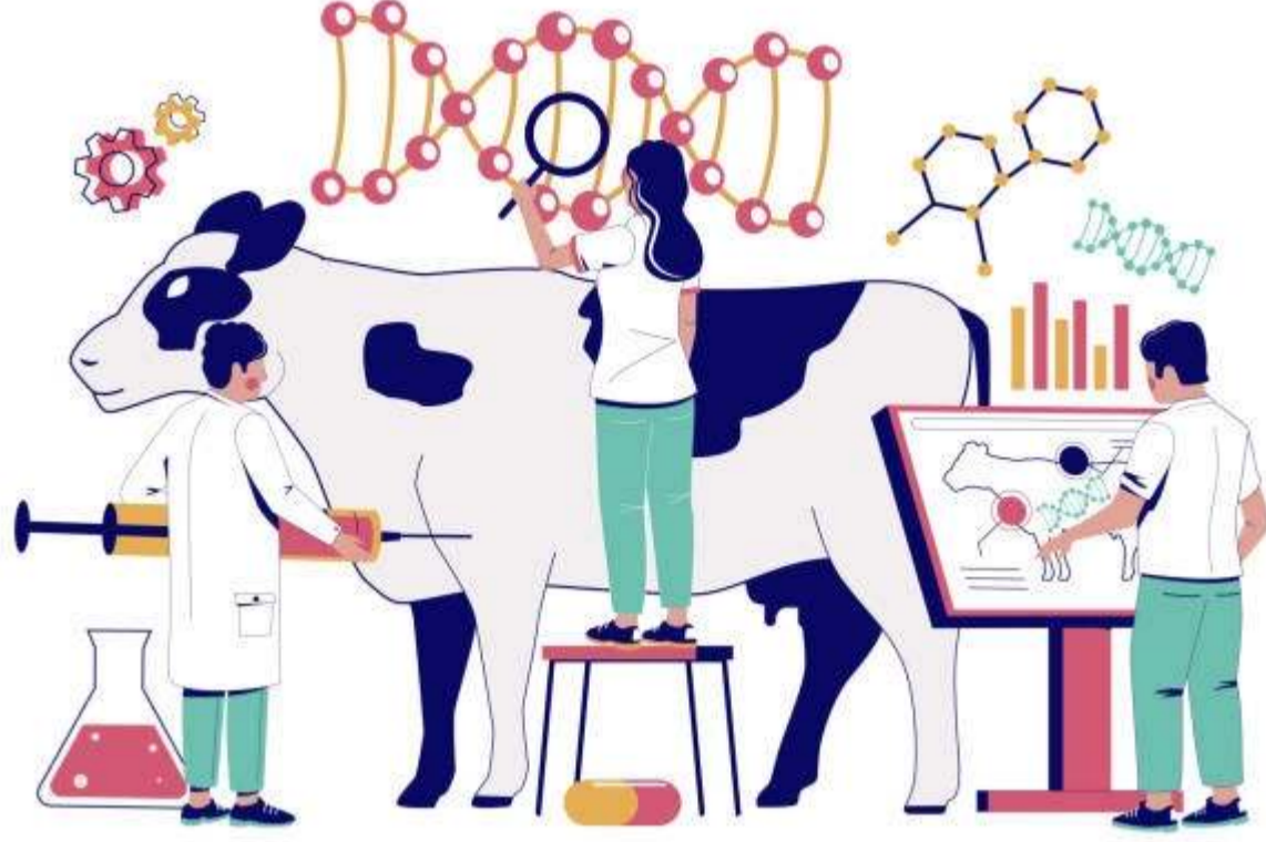
GENETICALLY MODIFIED ANIMALS