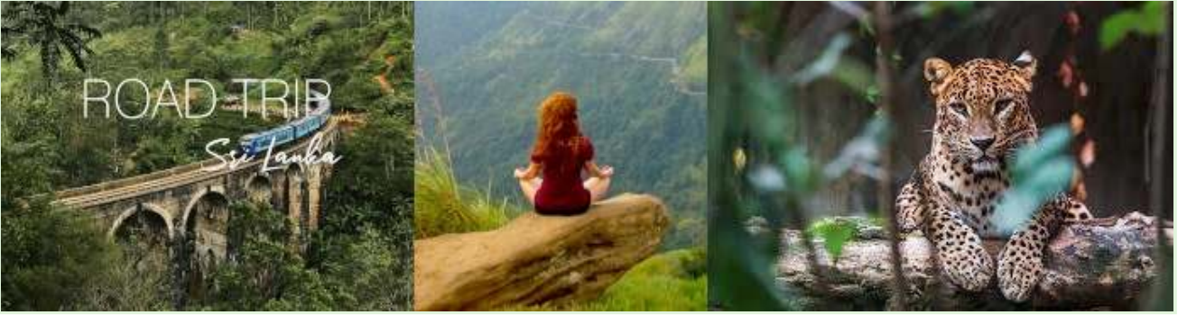
Sri Lanka tatilleri - Rehberli doğa turları ve keşif gezileri

Zamanlama: Deney, Sri Lanka'nın turizme bağımlı ekonomisinin zaten ciddi şekilde etkilendiği COVID-19 salgını sırasında başlatıldı.