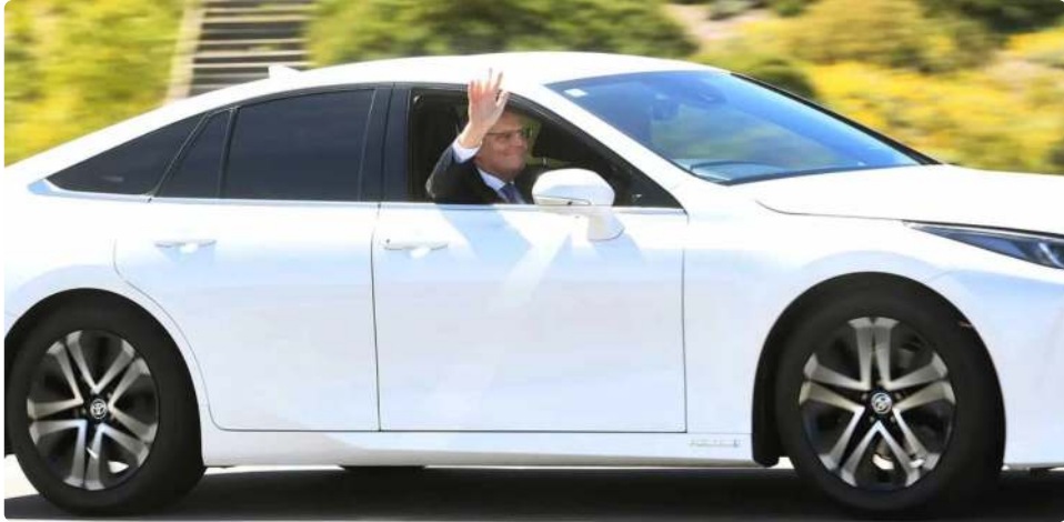
Thủ tướng Úc Scott Morrison trên chiếc ô tô chạy bằng nhiên liệu hydro