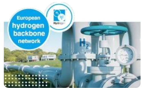
Đường ống hydro châu Âu

Chính phủ 🇩🇪 Đức mong muốn có một triệu ô tô chạy bằng hydro trên đường vào năm 2030 và 🇪🇺 châu Âu đang đầu tư 100 tỷ euro để phát triển mạng lưới đường ống dẫn hydro .